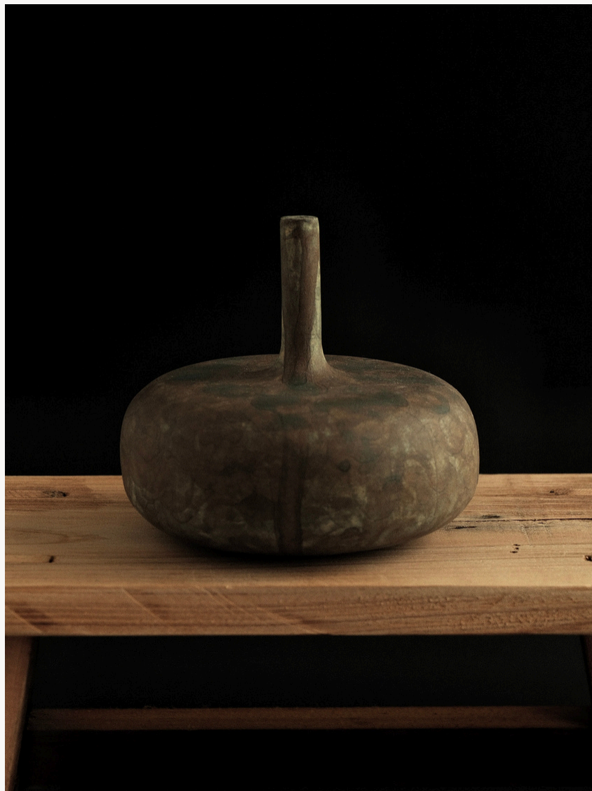
Sans titre Grès, façonné à la main (technique du colombin) Oxydes minéraux naturels Cuisson haute température 10 cm H x Ø 34 cm Pièce unique — 2025