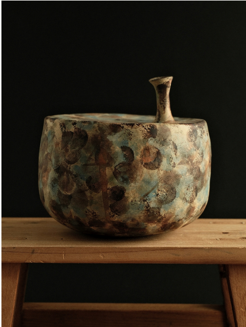
Sans titre Grès, façonné à la main (technique du colombin) Oxydes minéraux naturels Cuisson haute température 16 cm H x Ø 47 cm Pièce unique — 2025