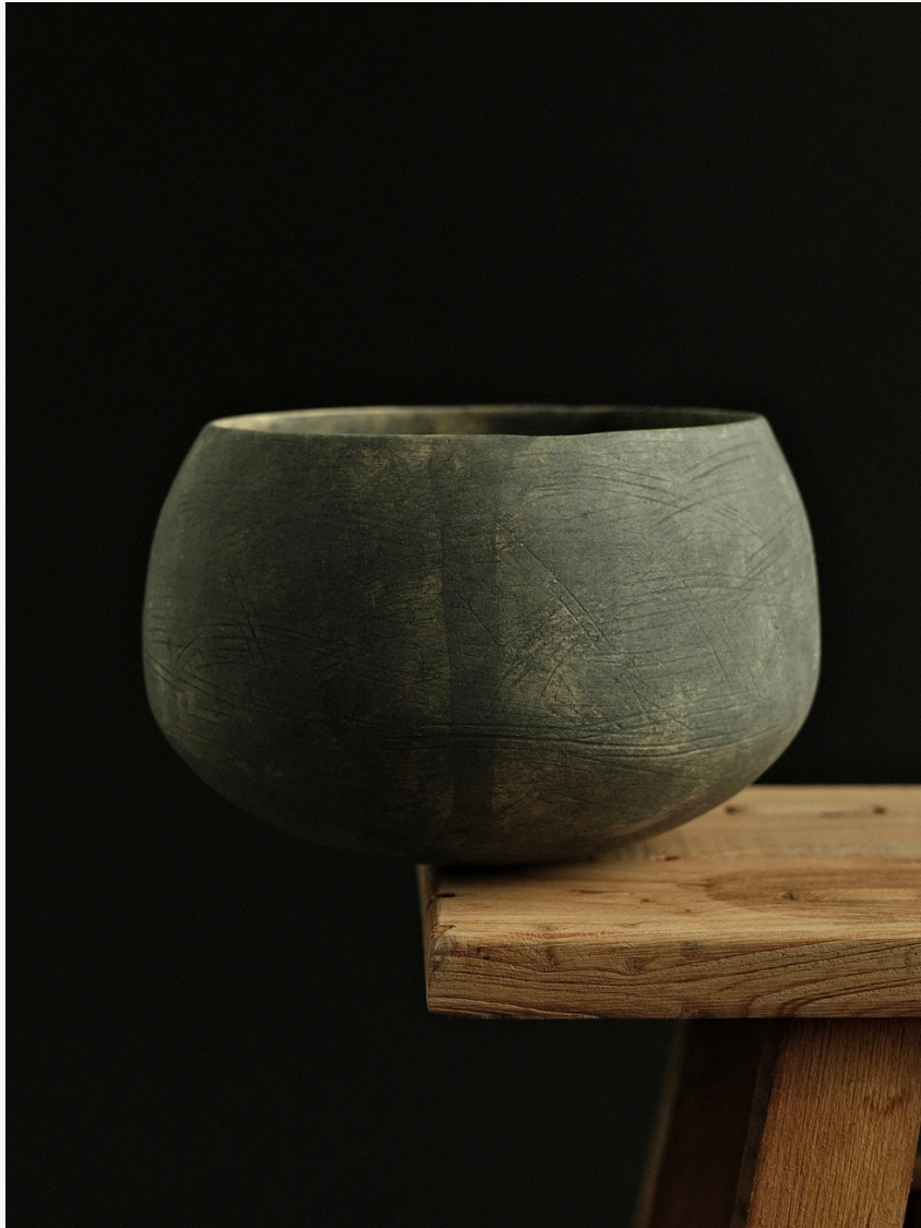
Sans titre Grès, façonné à la main (technique du colombin) Oxydes minéraux naturels Cuisson haute température 7 cm H x Ø 40 cm Pièce unique — 2025