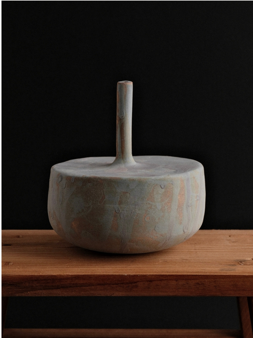
Sans titre Grès, façonné à la main (technique du colombin) Oxydes minéraux naturels Cuisson haute température 13 cm H x Ø 36 cm Pièce unique — 2025