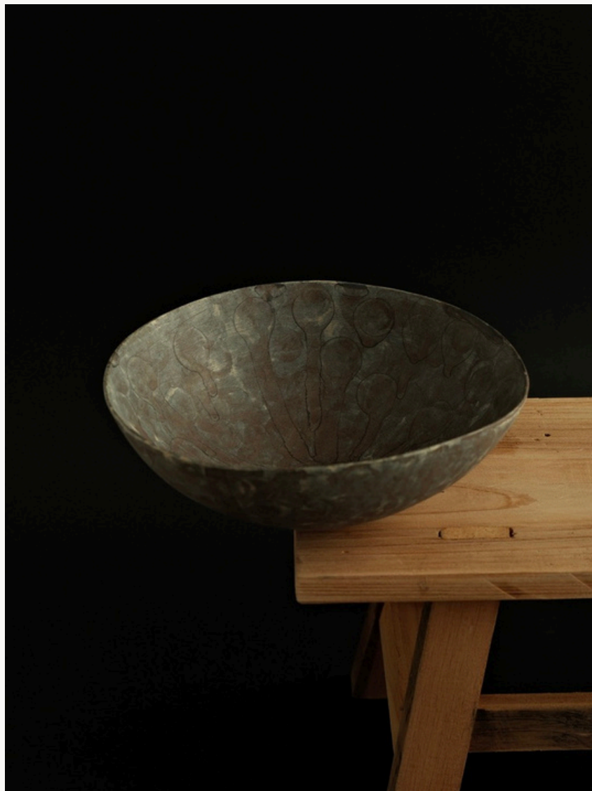
Sans titre Grès, façonné à la main (technique du colombin) Oxydes minéraux naturels Cuisson haute température 6 cm H x Ø 57 cm Pièce unique — 2025