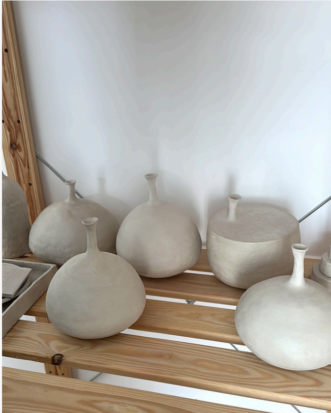
Séchage des formes