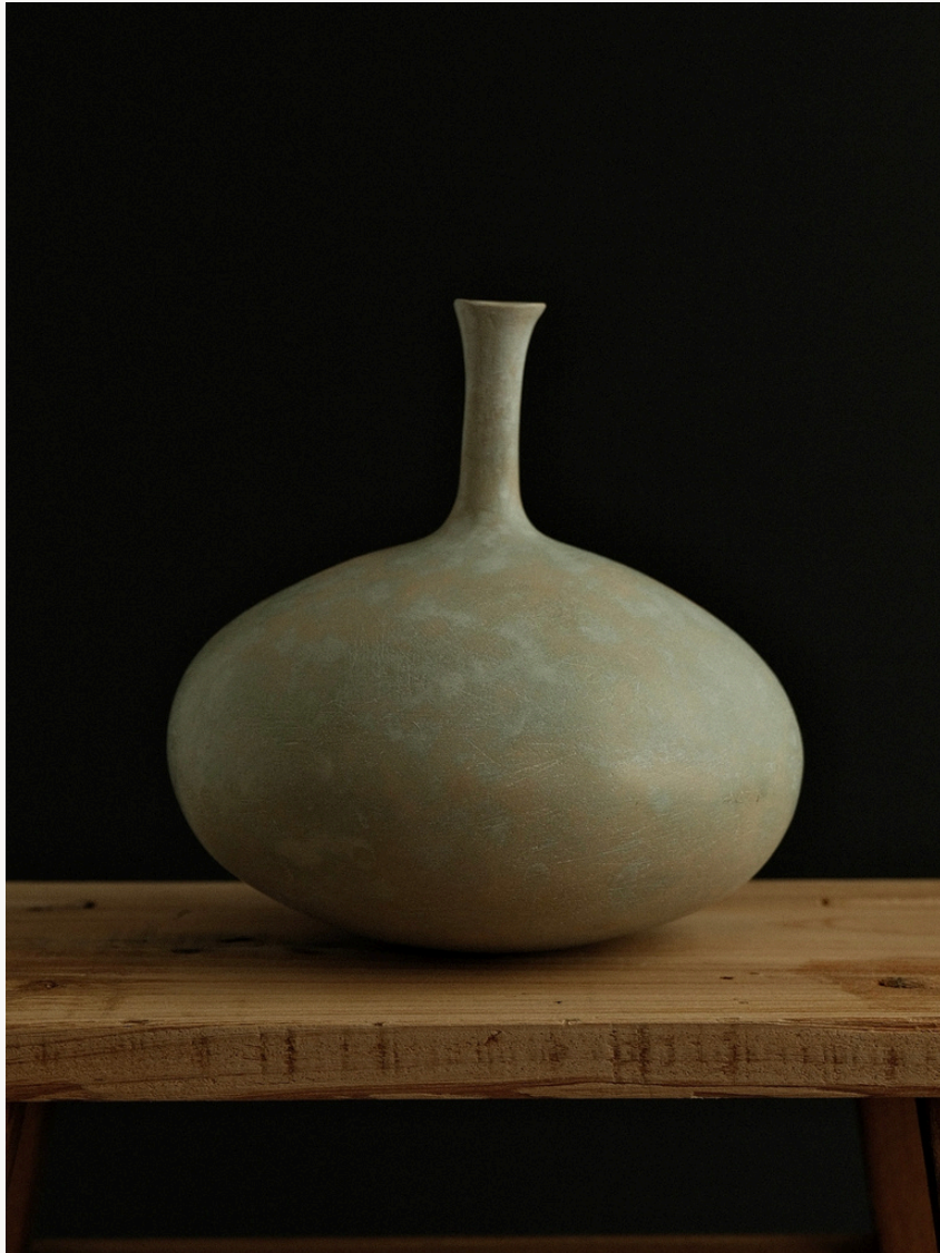
Sans titre Grès, façonné à la main (technique du colombin) Oxydes minéraux naturels Cuisson haute température 12 cm H x Ø 39 cm Pièce unique — 2025